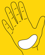
talon de la main